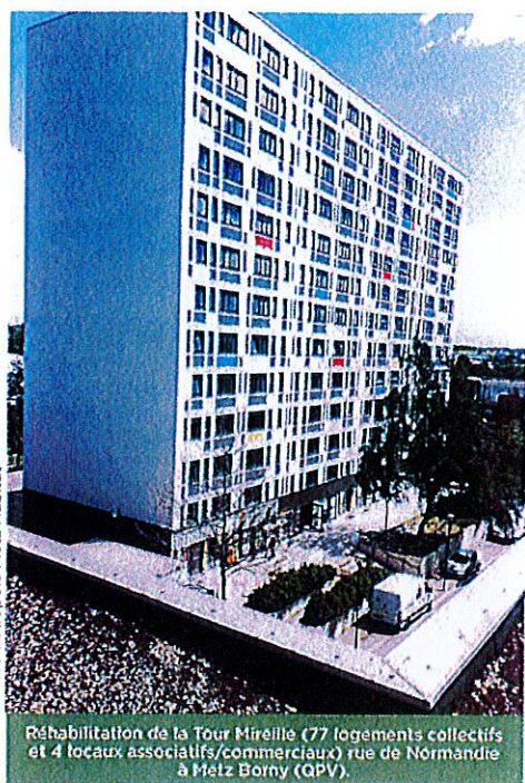
Réhabilitation de la Tour Mireille (77 logements collectifs et 4 locaux associatifs/commerciaux) rue de Normandie à Metz Borny (QPV).

Pour son premier anniversaire sous son nouveau statut, la SEM EMH a effectué un premier point d'étape. Les voyants sont au vert grâce à une modernisation de l'entreprise couplée à des projets ambitieux. L'objectif principal est clair : redevenir le bailleur numéro 1 de l'Eurométropole.